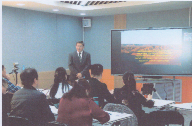
Сургалтын нээлт буюу УГА-Танилцуулга