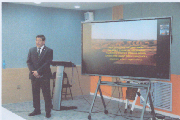
Хавсралт 3. Сургалтад оролцогчдын фото зураг